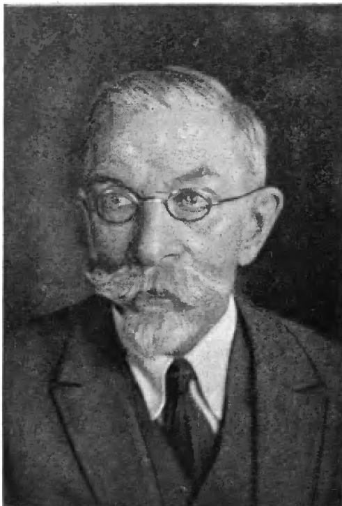
Член-корр. АН СССР С. Н. БЛАЖКО.

Кроме выполнявшегося С. Н. Блажко изучения всех открываемых на Московской обсерватории переменных звёзд и специального исследования затмевающихся звёзд, отметим его важное открытие изменений формы кривых блеска у некоторых короткопериодических цефеид. Эти изменения, имеющие периодический характер, названы «эффектом Блажко». Кроме того, у большинства короткопериодических цефеид, обнаруживающих этот эффект, были открыты периодические изменения пе-